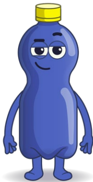
Nome: Petrrix Materiale riciclabile: Bottiglie in PET per bevande