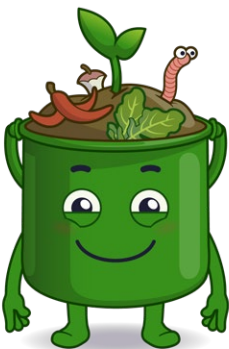
Nome: Compostix Materiale riciclabile: Rifiuti verdi (giardino e scarti di cucina)