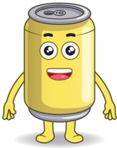
Nome: Aluminix Materiale riciclabile: Alluminio/ lattine in alluminio

Qui sono raffigurati i Materilli rilevanti per i documenti presenti (ciclo 1). I modelli per altri Materilli in diverse pose possono essere scaricati qui: Heroes & Materilli