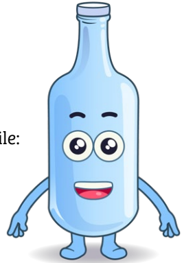
Nome: Glasefix Materiale riciclabile: Vetro usato