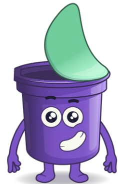
Nome: Plastix Materiale riciclabile: Imballaggi in plastica