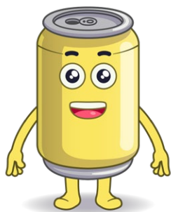
Nom: Aluminix Substance valorisable: aluminium/canette en aluminium

Sont représentés ici les matériaux pertinents pour les présents documents (cycle 1). D'autres modèles de matériaux peuvent être téléchargés ici dans différentes poses: Héros et matériaux