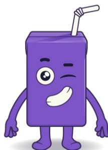
Nom: Drinkix Substance valorisable: brique à boisson