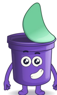
Nom: Plastix Substance valorisable: emballages en plastique