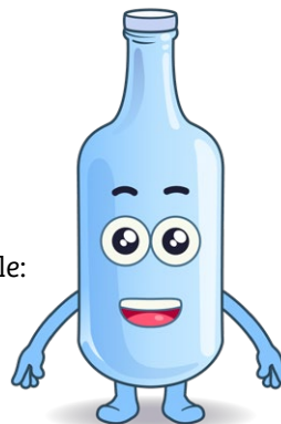
Nom: Glasefix Substance valorisable: verre usagé