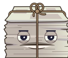
Nom: Paperix Substance valorisable: papier